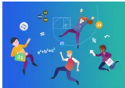
Mathemateg a Rhifedd