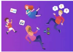
Iechyd a Lles